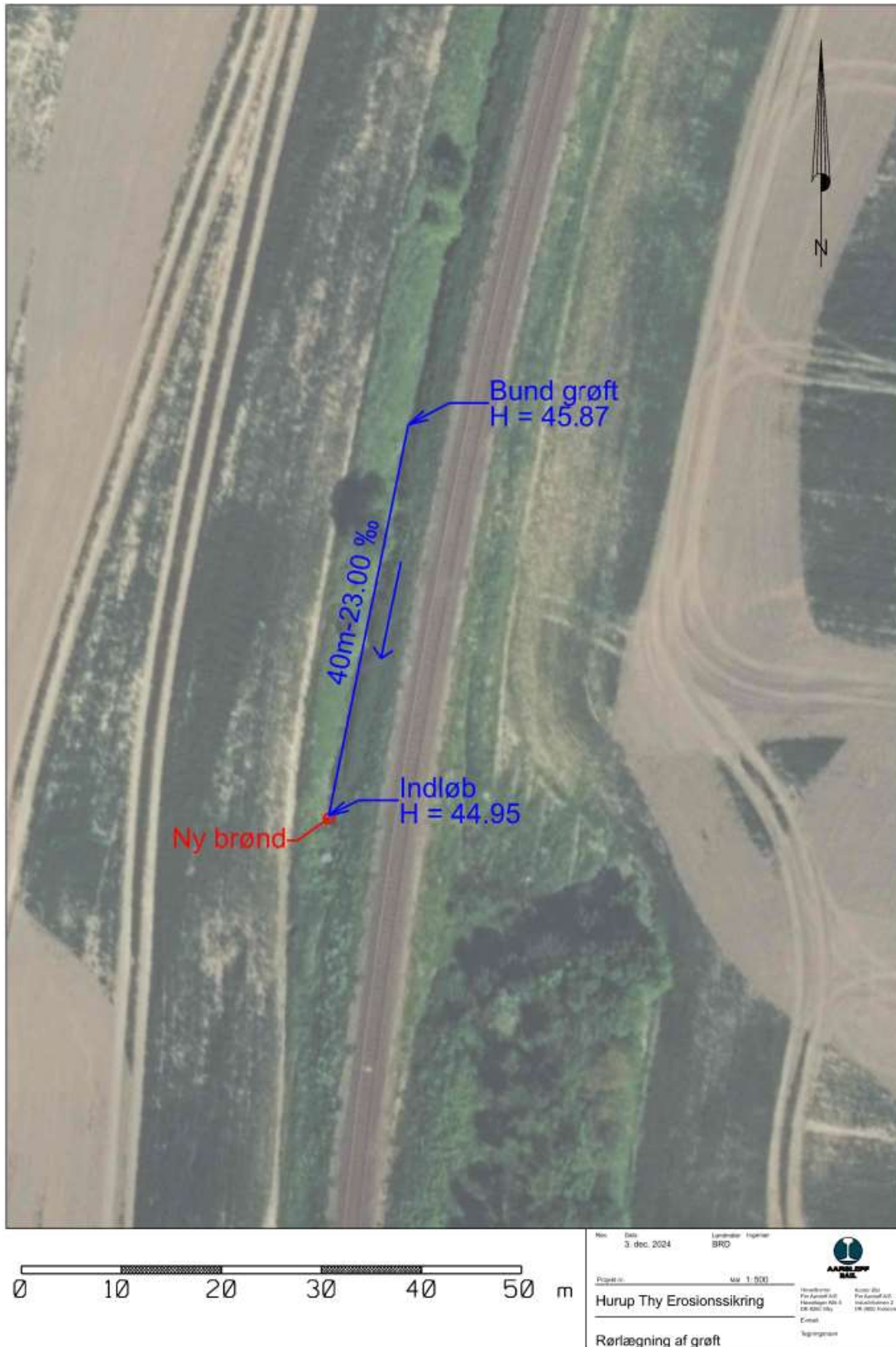
Figur 2. Detailkort